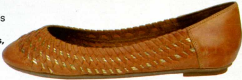
Ballerines en cuir, 3 Suisses , 59,90 €