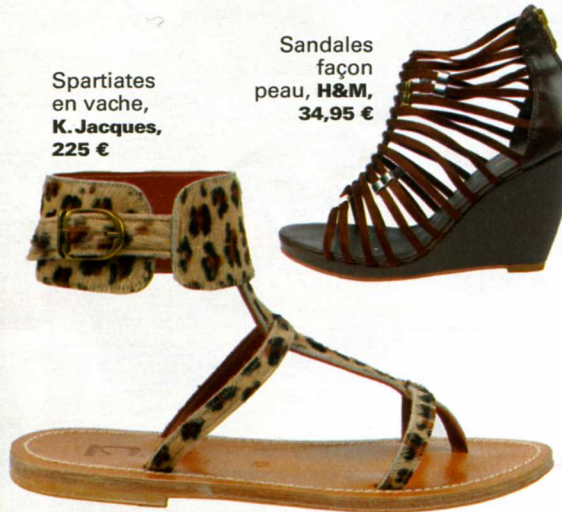
Sandales façon peau, H&M , 34,95 €