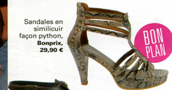
Sandales en similicuir façon python, Bonprix , 29,90 €