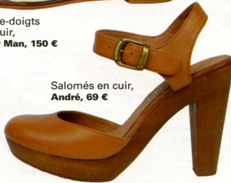
Salomés en cuir, André , 69 €