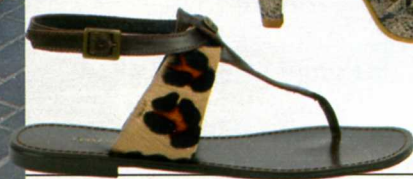
Entre-doigts en cuir, Minelli , 69 €