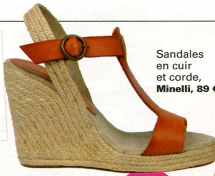
Sandales en cuir et corde, Minelli , 89 €