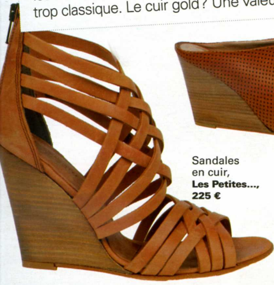
Sandales en cuir, Les Petites... , 225 €

Authentique et chic, la tendance calme les tenues excentriques et dynamise un look trop classique. Le cuir gold? Une valeur sûre.