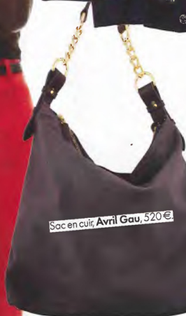
Sac en cuir, Avril Gau, 520€