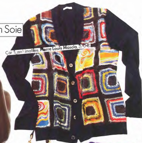
Cardigan "matière, Pierre Louis Mascia, 370€