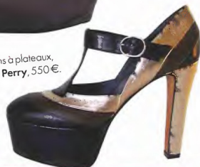
Escarpins à plateaux, Michel Perry, 550€