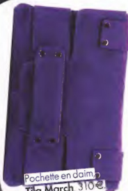
Pochette en daim, Tila March, 310€